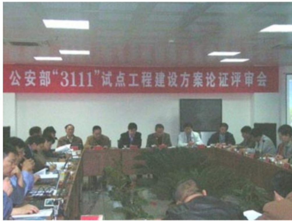
公安部“3111”试点工程建设方案论证评审会现场

国家“十一五规划”明确提出构建和谐社会，在建设“平安中国”、“科技强警”的政策推动下，中国安防市场迎来了前所未有的发展机遇。