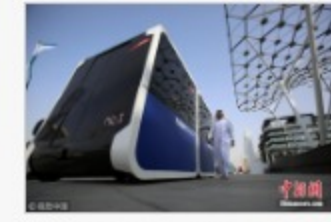
世界上第一个无人驾驶