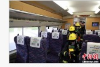
广西铁警开展动车应急