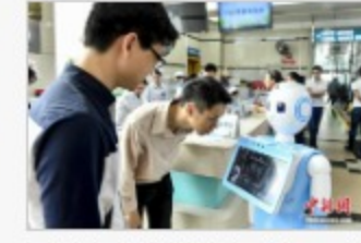
广州建成首个智慧医院