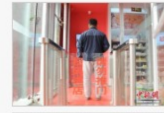
无人超市亮相长春市