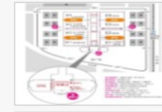
2018北京安博会都有哪