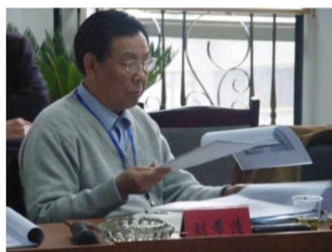
专家负责对各试点城市的方案进行论证评审

频监控系统入围厂家参加“广州市视频监控系统适用产品与集成服务商展示会”之后的又一个重要会议，为构建和谐社会又向前迈出了关键性的步伐！