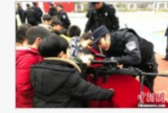
江苏盐城警方校园内开