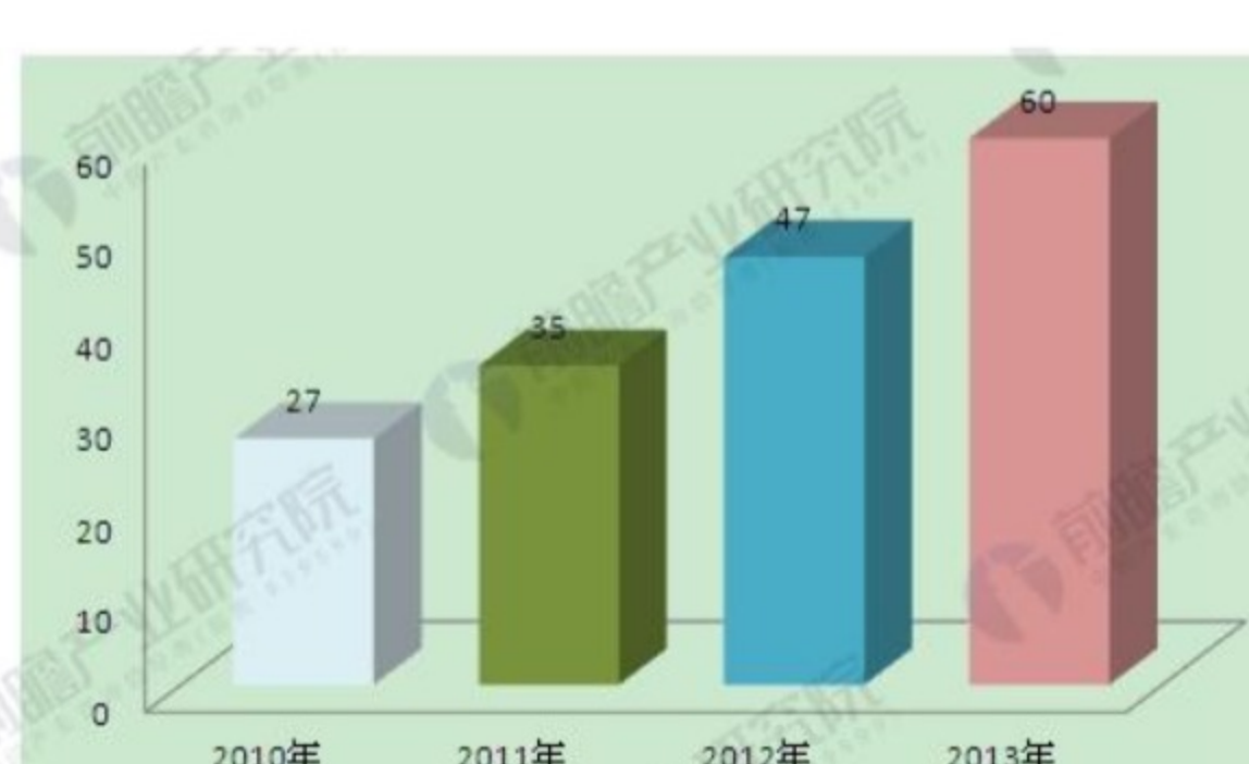
中国门禁系统市场规模(单位:亿元)

对门禁设备而言,在政府对大型基建项目的不断扩大投入和行业市场的迅猛发展下,2012年国内门禁系统产品销售市场规模达到47亿元,年增长34.29%,2013年市场规模或突破60亿元,预计门禁一卡通及相关配套工程产业链规模将进一步创造历史新高。